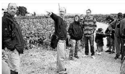
Els participants en la primera ruta guiada per l'horta de Burjassot. v. ruiz sancho

Turisme rural. Res millor que recórrer l'Horta Nord amb diversió, coneixement i respecte, a més d'aprendre de primera mà tot el patrimoni cultural que amaga. Des d'ara, Burjassot ofereix cada mes una excursió instructiva per l'horta.